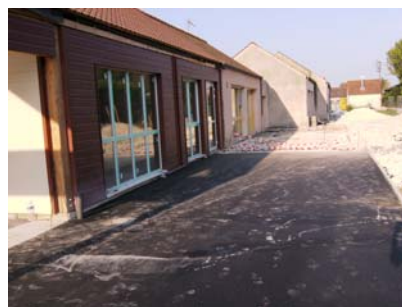
La cour latérale