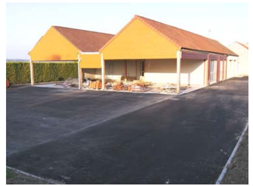
Une école qui prend forme... et bientôt vie

Dès que cette extension sera pratiquement terminée, une nouvelle visite des lieux sera organisée pour les personnes intéressées.