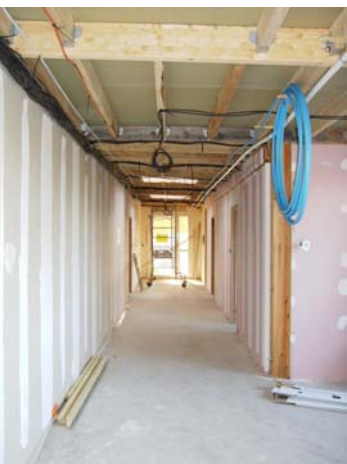
Mise en place de l'électricité