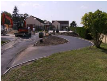
L'accès au parking public