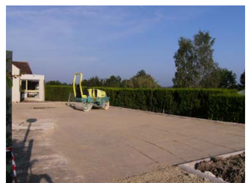
Parking des enseignants et du personnel