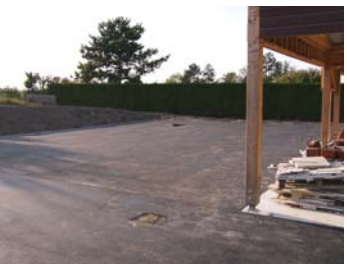
La cour de récréation