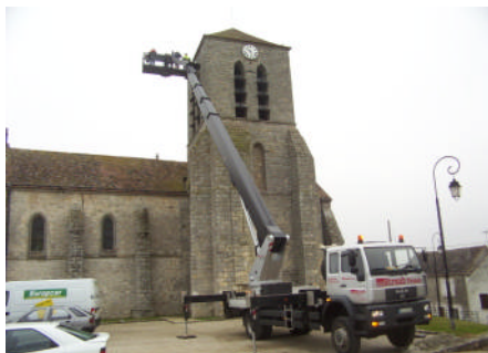
Des moyens spectaculaires pour mettre en œuvre cette guirlande

Une belle réussite que ce ruban lumineux qui vient égayer l'église durant ces fêtes de fin d'année.