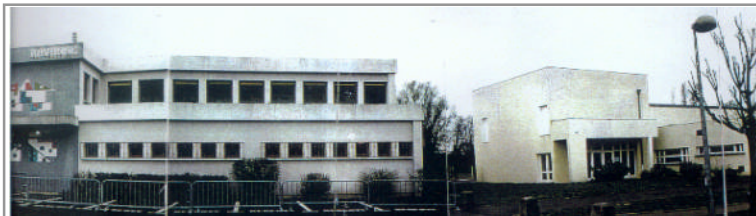
Groupe scolaire de RAVANNE état actuel