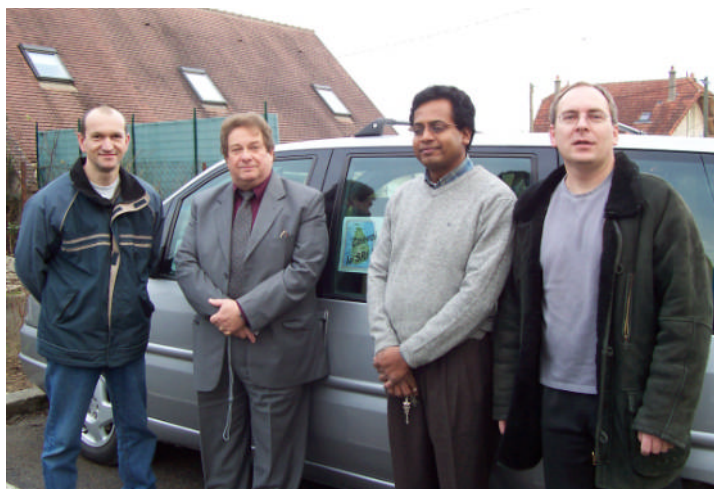
Départ de la Mairie

On rappellera le don de 2650 € octroyé par le Conseil municipal ainsi que l'urne qui est toujours à votre disposition au guichet de la mairie pour recevoir vos dons.