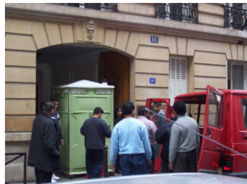
Ambassade du Sri Lanka à Paris

BRAVO ET ENCORE MERCI POUR TOUS CES GESTES DE GENEROSITE ET DE DEVOUEMENT EN FAVEUR DE CES POPULATIONS SINISTREES.