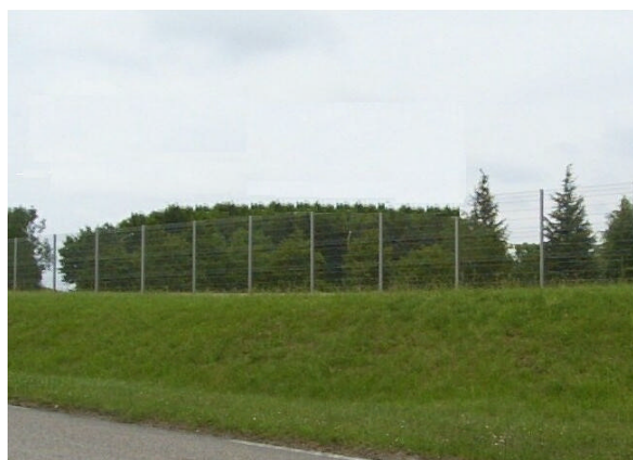
Un paysage "éclairci" (simulation)

... tout comme le porte-monnaie de la Commune qui va se retrouver allégé des taxes perçues sur ces équipements.